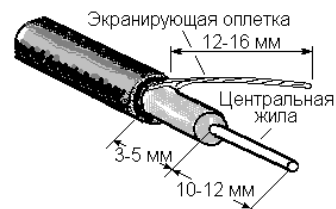
Рисунок 3 - Разделка конца кабеля

Антенны поставляются в разобранном виде. Элементы антенн изготовлены из стали с защитно-декоративным покрытием эпоксидной полиэфирной порошковой краской или оцинкованы. Сборку и установку антенн производить, как показано на рисунке 1. Перед установкой антенны на мачту необходимо подключить кабель снижения к антеннам без кабеля, установить две половины 6-элементного рефлектора с помощью кронштейнов и винтов с гайками (см. рисунок 1, вид А). Установить вибраторы 1-12 каналов (см. рисунок 1).