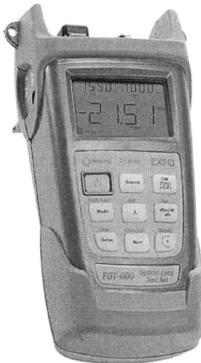
Рисунок 1 - Общий вид тестера

Тестер оптический FOT-600 представляет собой измеритель оптической мощности и источник оптического излучения, выполненные в малогабаритном пластмассовом корпусе. Возможны модификации тестера только с измерителем мощности (FPM-600) или только с источником излучения (FLS-600). Принцип действия измерителя мощности основан на преобразовании фотоприемником оптического сигнала в электрический с последующим усилением и преобразованием в цифровую форму. Источник оптического излучения основан на полупроводниковых лазерах или светодиодах. Серия 600 представлена следующими моделями: измерители оптической мощности FPM-602, FPM-602X; источники оптического излучения FLS-600-NNN, где NNN – одна из моделей излучателя 12D, 23BL, 234BL, 235BL, 01-VCL; тестеры оптические FOT-602-NNN, FOT-602X-NNN, где NNN – одна из вышеперечисленных моделей излучателя.